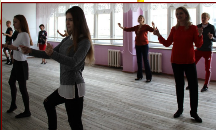
Учителя на уроке хореографии

игра» учителя демонстрировали широкий кругозор и внимательность. Последним пунктом в расписании «первоклашек» была праздничная линейка в виде